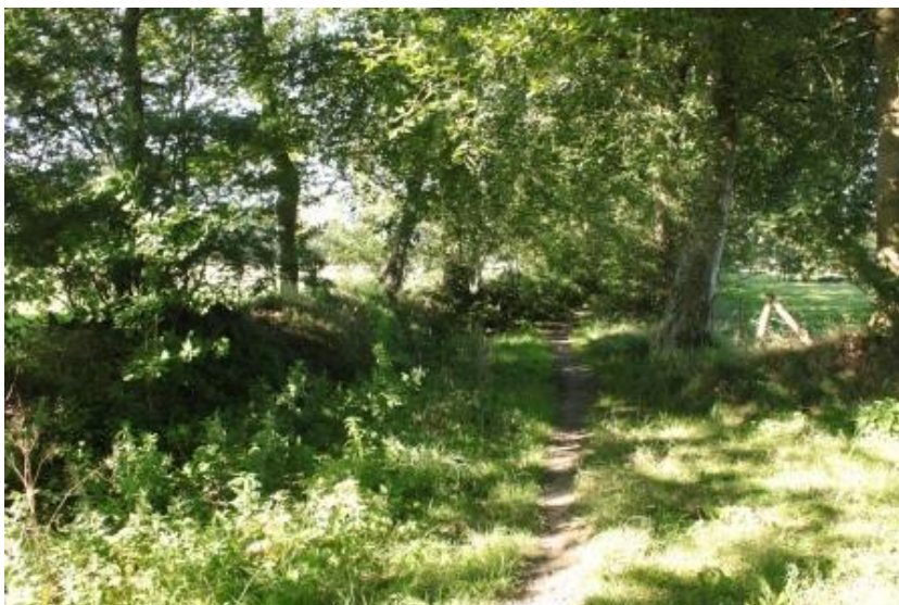
Houtwal in Noardlike Fryske Wâlden ( http://www.noardlikefryskewalden.nl/over-nfw/ )

Beschadiging van het wallichaam door vertrapping of aanvreten van de vegetatie door vee moet worden voorkomen door het plaatsen van een raster. Als er geen vee loopt, is een raster niet nodig.