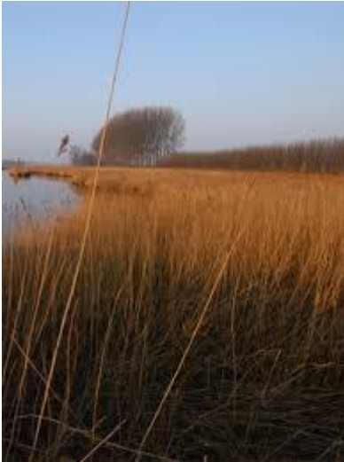
Rietzoom (Poldernatuur Zeeland)

Rietzomen bestaan uit smalle rietstroken die grenzen aan agrarisch gebruikte percelen. Vanwege een extensief gebruik zijn ze een belangrijk broedgebied voor rietvogels en daarnaast zijn ze van belang voor amfibieën, de ringslang, libellen en moerasvegetaties.