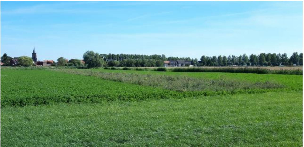
Gefaseerd gemaaide luzerne

Een aantal eiwitgewassen zijn vanwege de structuur en het feit dat ze tot bloei komen aantrekkelijk voor akkervogels, zeker in combinatie met akkerranden en andere permanente akkerhabitats. In dit beheerpakket is daarom de teelt van veldbonen en erwten opgenomen. De data waartussen het gewas aanwezig moet zijn, zijn afgestemd op de teelt van deze gewassen.