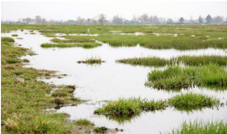
Plas dras in Krimpenerwaard

Het pakket met startdatum 15 februari heeft als voordeel dat de plasdras aanwezig is bij de start van het weidevogelseizoen, het pakket met startdatum 1 maart biedt een langere tijd voor de ontwikkeling van de bodemfauna. De plasdrassen in de periode mei-augustus hebben een functie als opvethabitat voor de vogels. De plasdras in november-december is bedoeld voor overwinterende soorten zoals de Kleine zwaan.