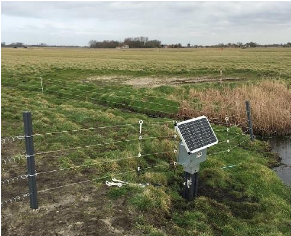
Vossenraster, collectief Water, Land en Dijken

Predatierasters om grondpredatoren te weren moeten worden onderhouden: gras onder het raster wegmaaien en het raster controleren op draden en spanning. Rasters staan veelal om een aantal beheereenheden met weidevogelmaatregelen geplaatst, maar ook rasters om individuele nesten, zoals van de wulp zijn effectieve maatregelen in specifieke gebieden. De vergoeding voor het pakket betreft het plaatsen, onderhouden en weer verwijderen van het raster. Het is belangrijk je goed te laten informeren over het type raster, de plaatsing en het onderhoud zodat het past bij het mozaïek en de doelsoorten. Het (onderhoud van het) raster mag de rust op het perceel niet verstoren.