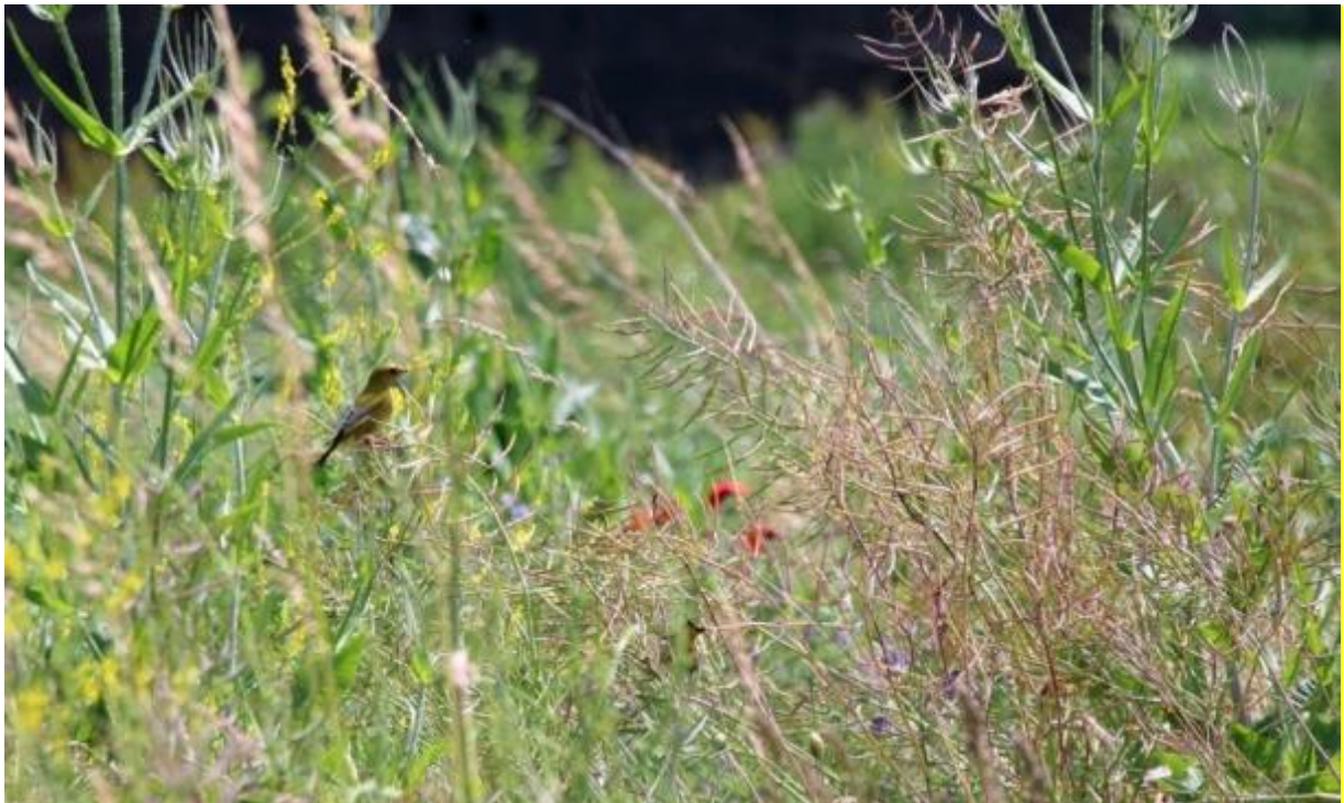
Bloemenblok in de zomer

Bloemenblokken bieden voedsel, veiligheid en voortplantingshabitat. Vogels vinden er veilige broedgelegenheden en voedsel voor kuikens. Patrijzenkuikens en jongen van andere boerenlandvogels eten in de eerste twee weken van hun leven voornamelijk insecten. Dit eiwitrijke voedsel is essentieel voor de groei van kuikens. Daarnaast is er volop zaad te vinden in de herfst en winter én bladgroen aan het einde van de winter als de zaden op raken. Bovendien biedt de begroeiing dekking tegen predatoren en slechte weersomstandigheden. Naast patrijzen zijn er nog vele andere vogelsoorten die van een bloemenblok kunnen profiteren. Ook vlinders, bijen en hommels profiteren van het grote aanbod van bloemen.