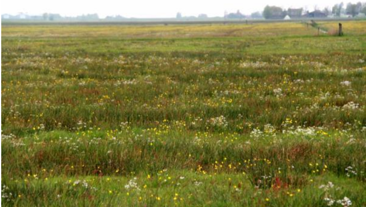
Kruidenrijk grasland

Op kruidenrijke graslanden komen de kruiden van nature in grotere aantallen voor en zijn verspreid over het hele perceel. De zode is open en divers van structuur door de vele kruiden met veel bloei-stengels en weinig blad. Dit heeft ook als voordeel dat kuikens zich goed kunnen voortbewegen in het grasland.