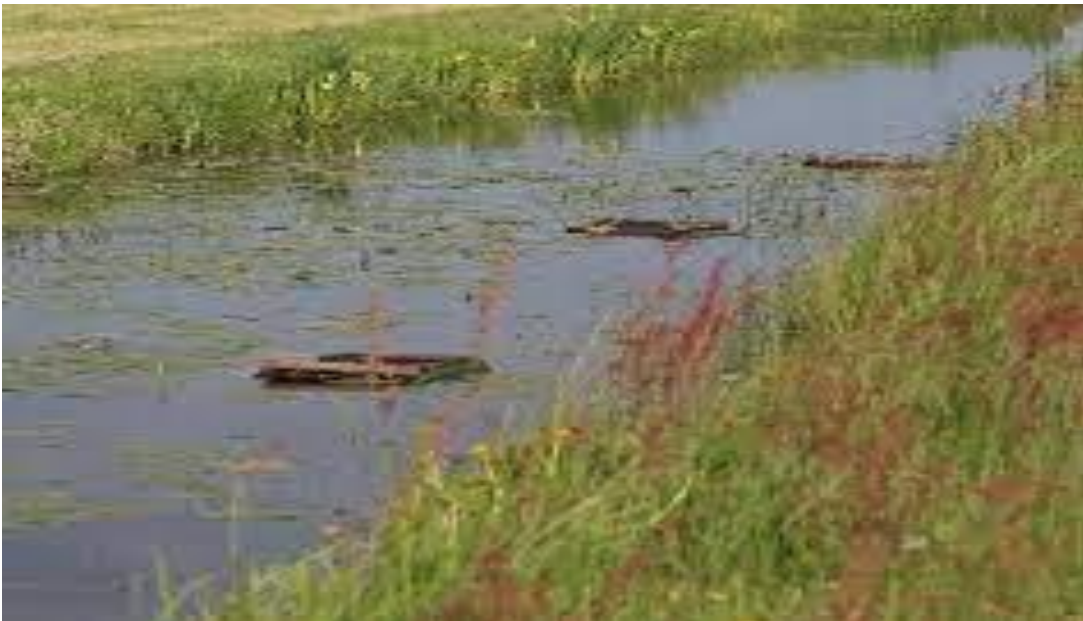
Nestvlotjes voor Zwarte stern

De rustperiode op de aangrenzende oevers duurt tot minimaal 1 juli. Als er vóór 15 juni geen nesten aanwezig zijn op de vlotjes, zullen er geen broedpogingen meer komen en kan de rustperiode tot 15 juni duren.