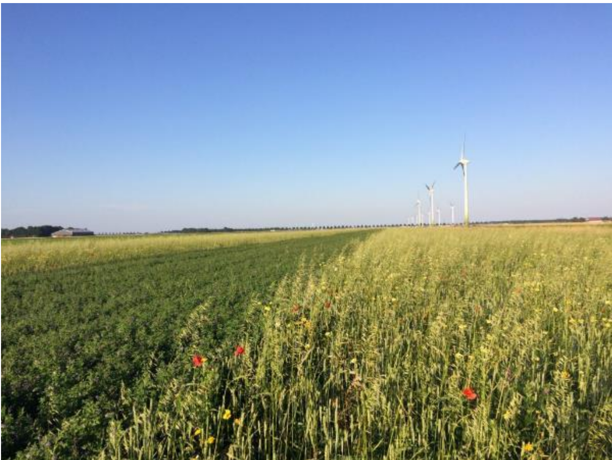
Vogelakker in Flevoland, vogelakkers zijn ontwikkeld door de Werkgroep Grauwe Kiekendief

Vogelakkers zijn bedoeld voor muizenetende roofvogels en uilen, maar ook broedende veldleeuweriken en overwinterende akkervogels worden door Vogelakkers aangetrokken. Om goed te functioneren moeten vogelakkers meerdere jaren op dezelfde plek liggen, zodat de muizenpopulatie zich kan opbouwen. Een vogelakker moet na een paar jaar vernieuwd of verplaatst worden. Voor het laatste jaar kan pakketvariant b gebruikt worden, zodat in het najaar de grond bewerkt kan worden.