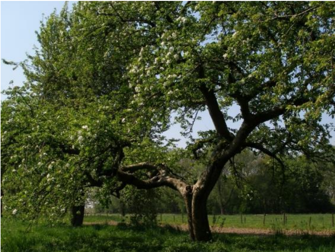
Oude appelboom in hoogstamboomgaard

Boomgaarden passen in het leefgebied Dooradering. Voorbeelden van doelsoorten zijn Gekraagde roodstaart, houtduif, kerkuil, spotvogel, steenuil en ingekorven vleermuis. Dit pakket kan worden afgesloten in hoogstamboomgaarden en halfstamboomgaarden.