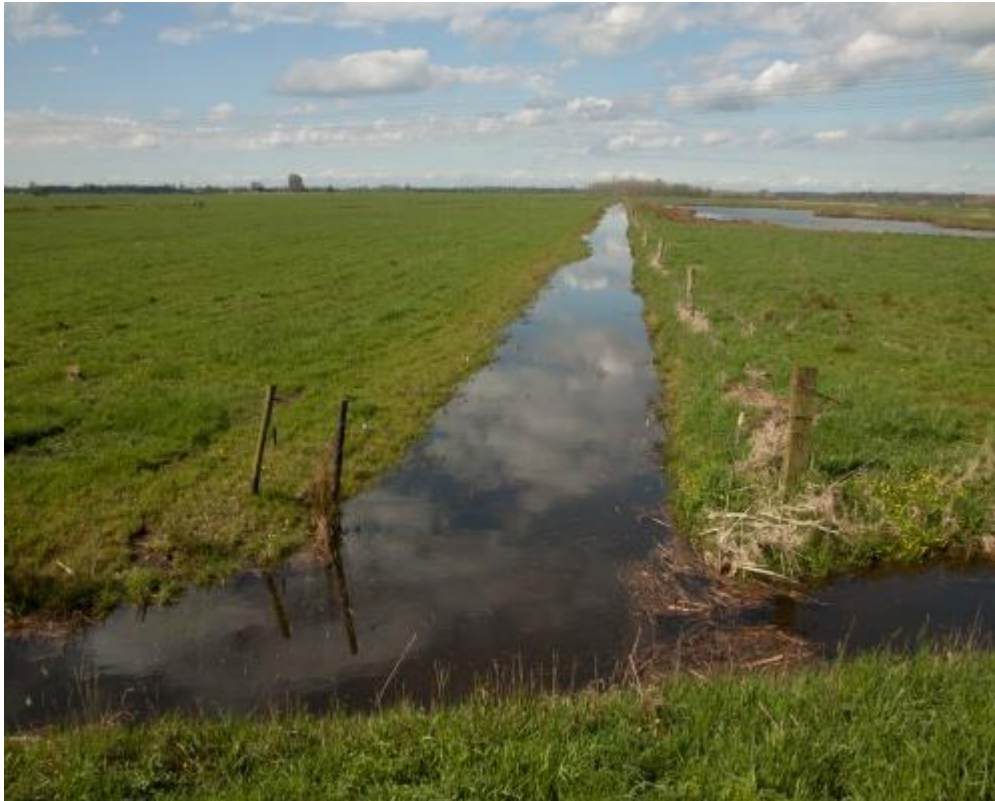
Hoog waterpeil in sloot remt de grasgroei in aangrenzend perceel

Door het slootpeil tijdelijk op te zetten ontstaat een plek waar het bodemleven goed beschikbaar is voor weidevogels. Ook vertraagt de grasgroei en wordt de structuur van de grasmat wat opener. Een hoog waterpeil werkt extra goed als het gelegen is naast kruidenrijk grasland, waar de weidevogels kunnen schuilen en als foerageergebied werkt voor de jonge vogels. De periode van hoog waterpeil is afgestemd op het weidevogelseizoen.